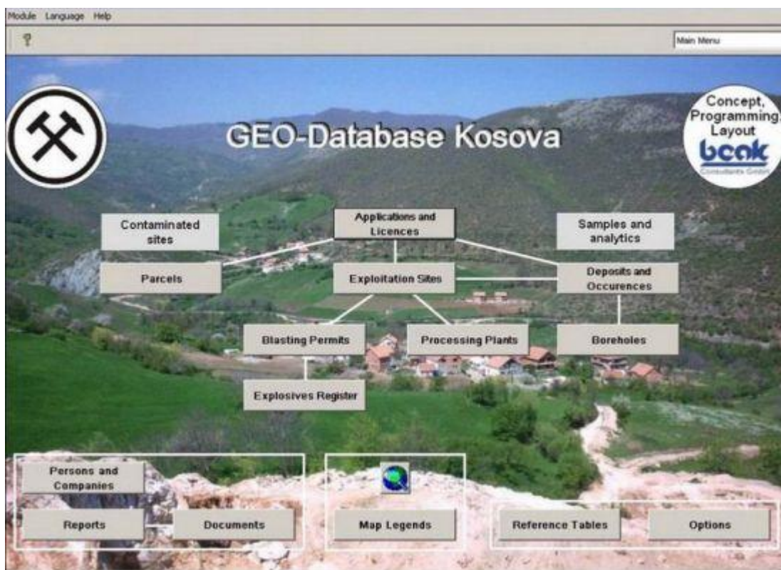
Te dhënat baze Gjeologjike të Kosovës – Ekrani i fillimit